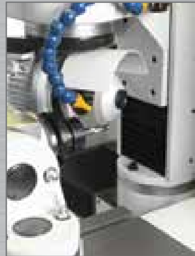
Nut Schleifung einer Spiralfräser. Helical tool - gullet grinding.